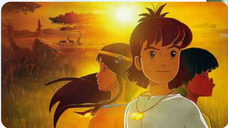
« Les Mystérieuses Cités d'Or », série réalisée par Jean-Luc François : une exposition au pôle image Magelis d'Angoulême