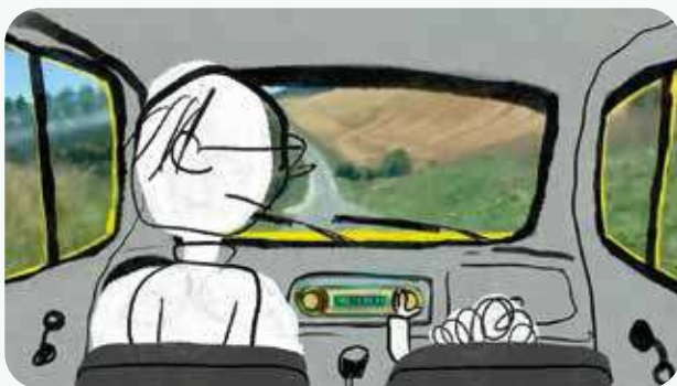
« L'effet de mes rides » de Claude Delafosse