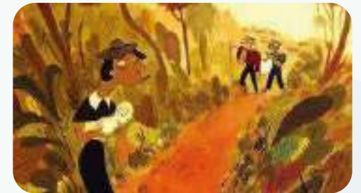
« Miracallas » de Raphaëlle Stolz et Augusto Zanovello