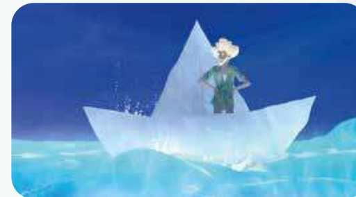
« L'île », d'Anca Damian, co-scénarisé par Augusto Zanovello.