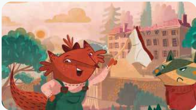
« Polo sans Bobo », de Sophie Casteignede