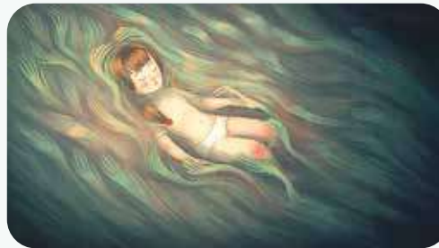
« Pachyderme » de Stéphanie Clément