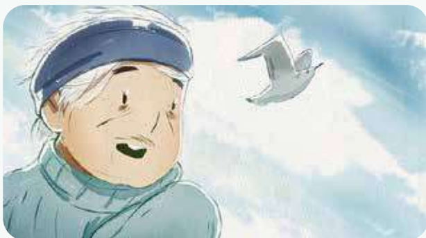
« L'air de rien » de Gabriel Hénot-Lefèvre

LE CARREFOUR DE L'ANIMATION (9 AU 15 DÉCEMBRE) AU FORUM DES IMAGES, A SÉLECTIONNÉ 4 COURTS MÉTRAGES D'AUTEUR.ICE.S DE L'AGRAF :