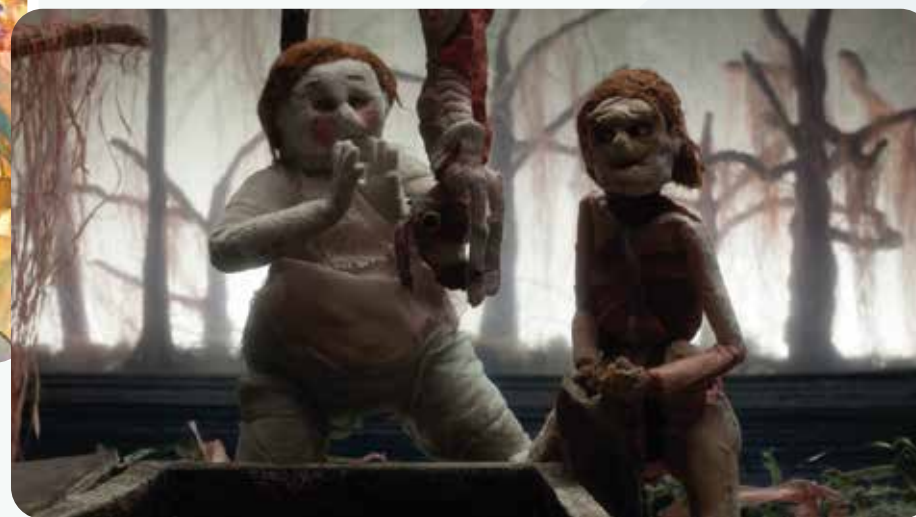
« Écorchée », court métrage de Joachim Hérissé, sélectionné aux Césars 2023