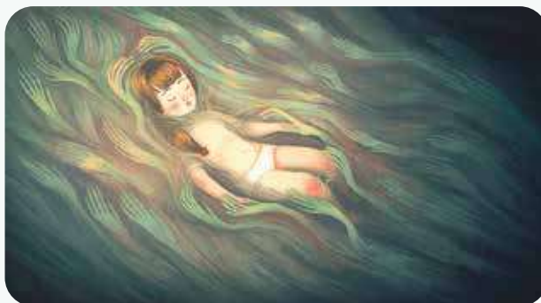
« Pachyderme » de Stéphanie Clément