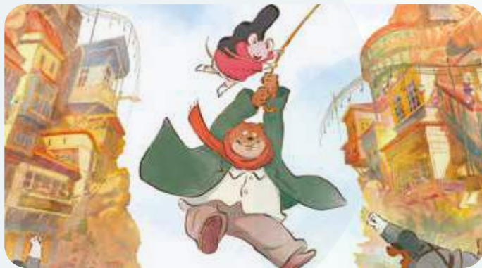
« Ernest et Célestine, le Voyage en Charabie » co-scénarisé par Jean Regnaud