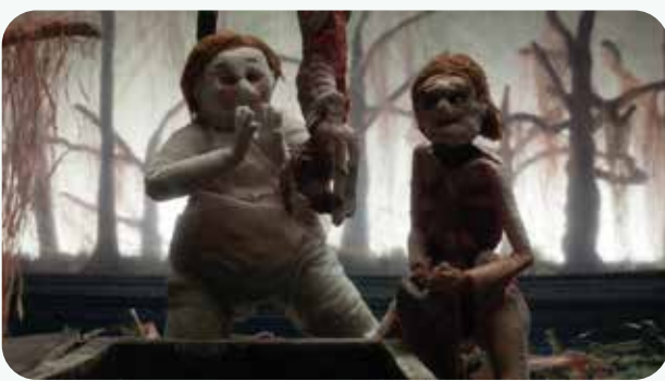
« Écorchée » de Joachim Hérisse